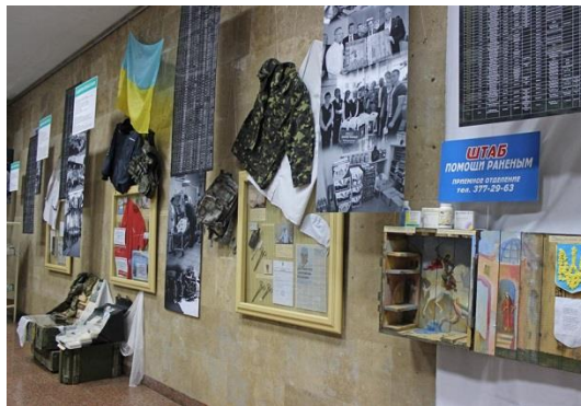
Фото 11. «Місто милосердя. Лікарня Мечникова» (2 квітня 2018 - 17 травня 2018)