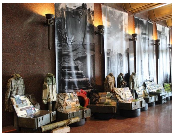
Фото 10. «На лінії вогню» (8 травня 2018 - 10 вересня 2019)