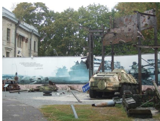
Фото 2. Вулична експозиція «Шляхами Донбасу»