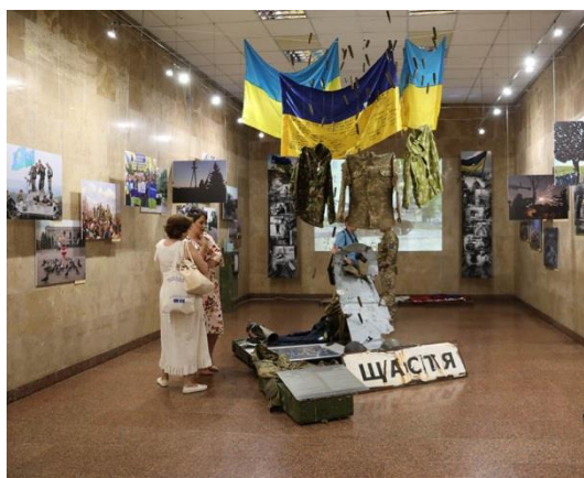
Фото 9. «Вертаємо своє» (3 липня 2019 - 18 вересня 2019)

Усі ці роки музейники стежили за розвитком подій на Сході України, збирали пов'язані з ними автентичні матеріали в усіх регіонах країни, включно із зоною бойових дій, готували тематичні виставки та проводили просвітницько-комунікативні заходи. За цей час фондозбірня поповнилася понад 10 тис. музейних предметів, що є свідками звитяги й жертвності українських воїнів, які відстоюють суверенітет і територіальну цілісність нашої держави на її східних теренах. Водночас вони розкривають реалії життя цивільного населення, яке страждає, виживає, бореться, а також соціогуманітарні проблеми, породжені бойовими діями й тимчасовою окупацією. Детальніше з прикладами експозиційних рішень можна ознайомитись на сайті музею.