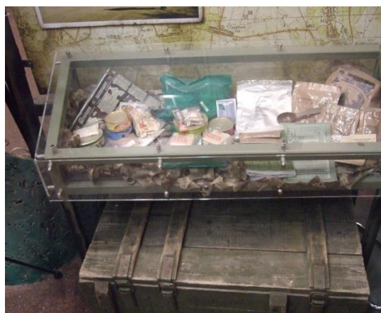
Фото 6. Основна експозиція (I поверх діорами)