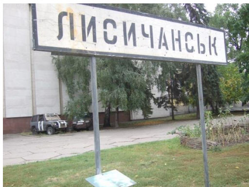
Фото 1. Вулична експозиція «Шляхами Донбасу»