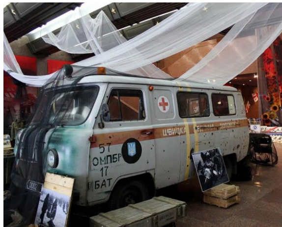
Фото 12. «Український Схід» (лютий 2017 - травень 2018)