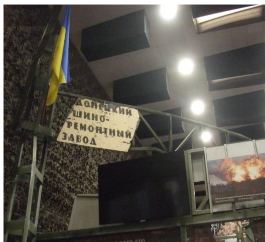
Фото 3. Основна експозиція (I поверх діорами)