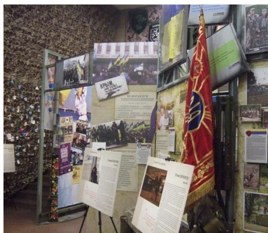
Фото 4. Основна експозиція (I поверх діорами)