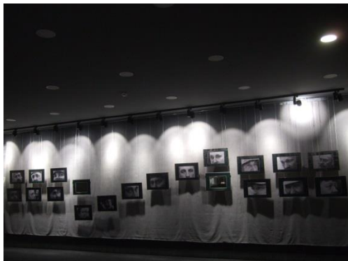
Фото 7. Зал пам'яті загиблих в зоні АТО