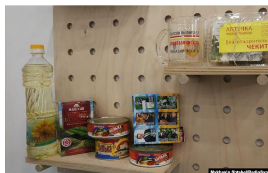
Фото 14. Фрагмент виставки