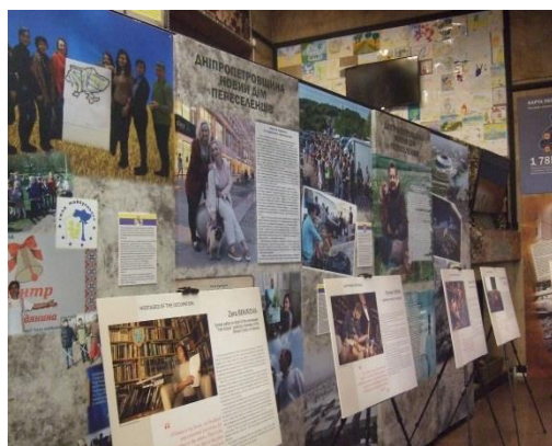
Фото 5. Основна експозиція (I поверх діорами)